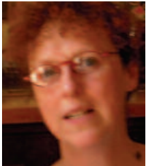
Après 2 heures d'interaction